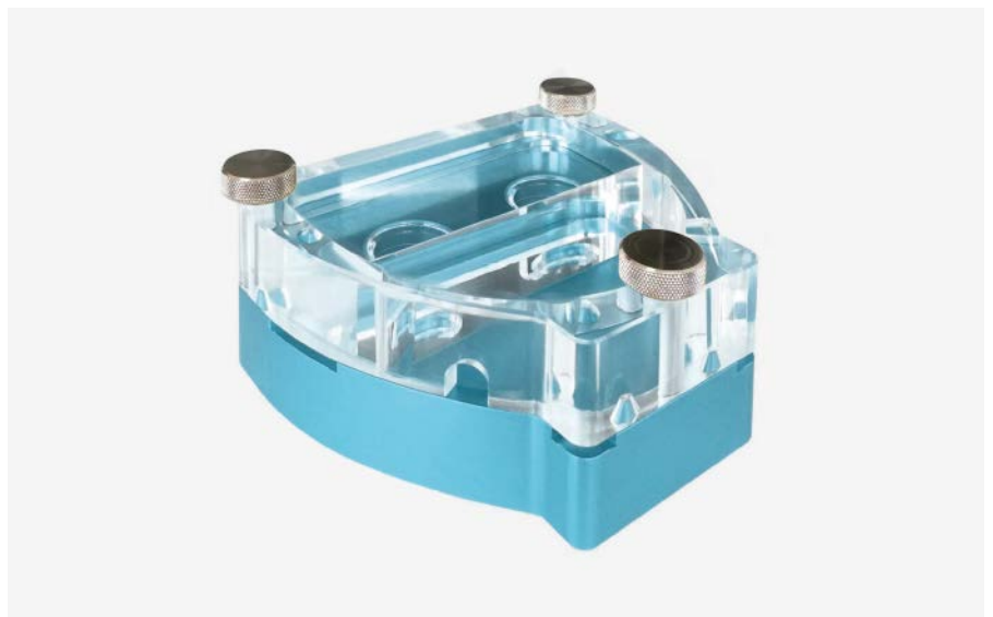
Acrylglas-Bauteilgruppe gefertigt von Soluma swiss AG

Warum und wofür auch immer eine perfekte Lösung mit Acrylglas (Plexiglas®) zur Anwendung kommen soll: Wenden Sie sich an uns. Wir klären gemeinsam mit Ihnen Ihre Bedürfnisse und die Rahmenbedingungen ab. Und präsentieren Ihnen eine massgeschneiderte Lösung.